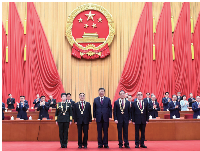
◎ 9月8日，全国抗击新冠肺炎疫情表彰大会在北京人民大会堂隆重举行。中共中央总书记、国家主席、中央军委主席习近平向“共和国勋章”获得者钟南山（前排右二），“人民英雄”国家荣誉称号获得者张伯礼（前排左二）、张定宇（前排右一）、陈薇（前排左一）颁授勋章奖章。

指出，为了隆重表彰在抗击新冠肺炎疫情斗争中作出杰出贡献的功勋模范人物，弘扬他们忠诚、担当、奉献的崇高品质，根据第十三届全国人民代表大会常务委员会第二十一次会议的决定，授予钟南山“共和国勋章”，授予张伯礼、张定宇、陈薇“人民英雄”国家荣誉称号。