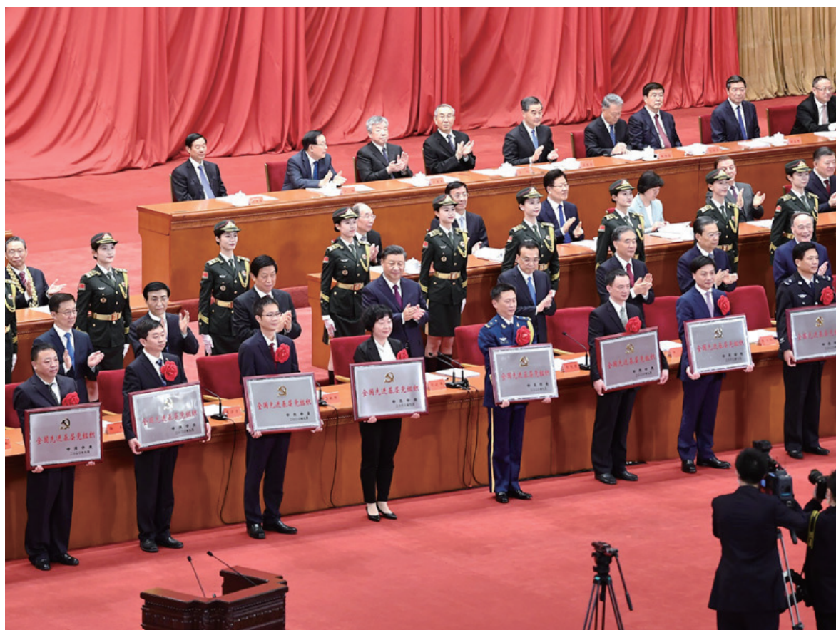
◎ 9月8日，全国抗击新冠肺炎疫情表彰大会在北京人民大会堂隆重举行。中共中央总书记、国家主席、中央军委主席习近平在大会上发表重要讲话。这是习近平等为受表彰的全国先进基层党组织代表颁奖。

习近平代表党中央、国务院和中央军委，向受到表彰的先进个人和先进集体，向为这次抗疫斗争作出重大贡献的广大医务工作者、疾控工作人员、人民解放军指战员、武警部队官兵、科技工作者、社区工作者、公安民警、应急救援人员、新闻工作者、企事业单位职工、工程建设者、下沉干部、志愿者以及广大人民群众，向各级党政机关和企事业单位广大党员、干部，致以崇高的敬意！向积极参与抗疫斗争的各民主党派、工商联和无党派人士、各人民团体以及社会各界，向踊跃提供援助的香港同胞、澳门同胞、台湾同胞以及海外华侨华人，表示衷心的感谢。