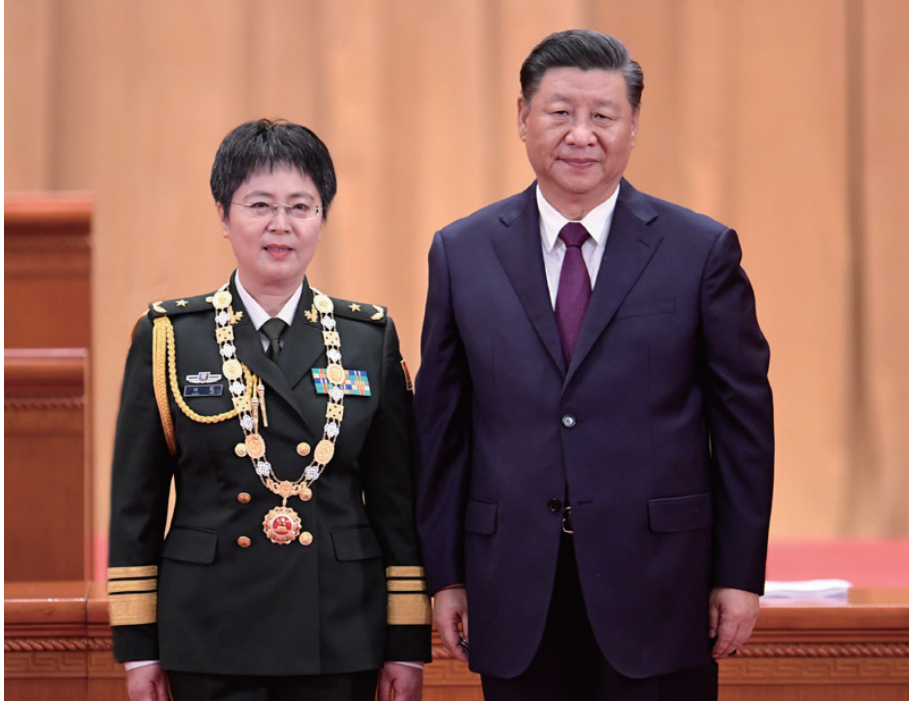
◎ 9月8日，全国抗击新冠肺炎疫情表彰大会在北京人民大会堂隆重举行。中共中央总书记、国家主席、中央军委主席习近平向“人民英雄”国家荣誉称号获得者陈薇颁授奖章。

王沪宁宣读《中共中央、国务院、中央军委关于表彰全国抗击新冠肺炎疫情先进个人和先进集体的决定》《中共中央关于表彰全国优秀共产党员和全国先进基层党组织的决定》。