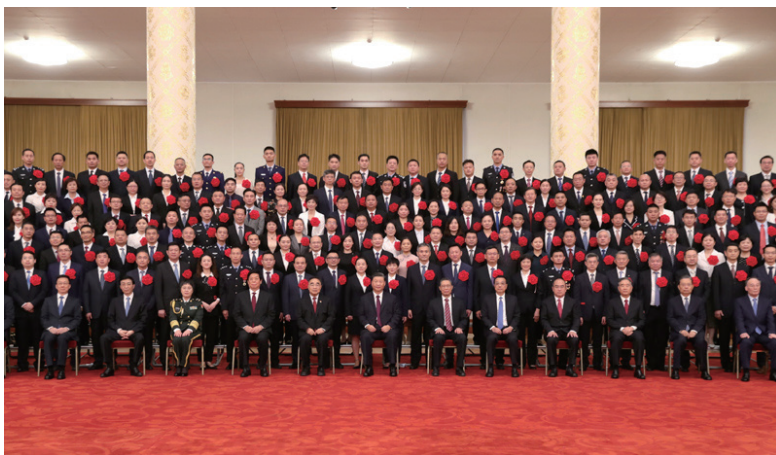
◎ 9月8日，全国抗击新冠肺炎疫情表彰大会在北京人民大会堂隆重举行。会前，习近平等党和国家领导人会见国家勋章和国家荣誉称号获得者，全国抗击新冠肺炎疫情先进个人、先进集体代表等，并同大家合影留念。新华社记者 黄敬文 摄

会前，习近平等领导同志会见了国家勋章和国家荣誉称号获得者，全国抗击新冠肺炎疫情先进个人、先进集体代表等，并同大家合影留念。