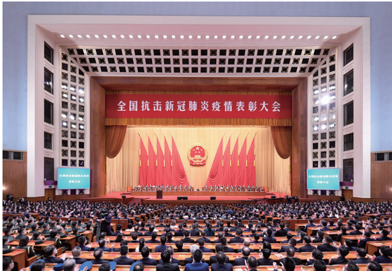
◎ 9月8日，全国抗击新冠肺炎疫情表彰大会在北京人民大会堂隆重举行。

会上，“共和国勋章”获得者钟南山，全国抗击新冠肺炎疫情先进个人、全国优秀共产党员、北京协和医院感染内科主任医师刘正印，全国抗击新冠肺炎疫情先进集体、全国先进基层党组织代表、武汉市青和居社区党总支书记桂小妹发言。