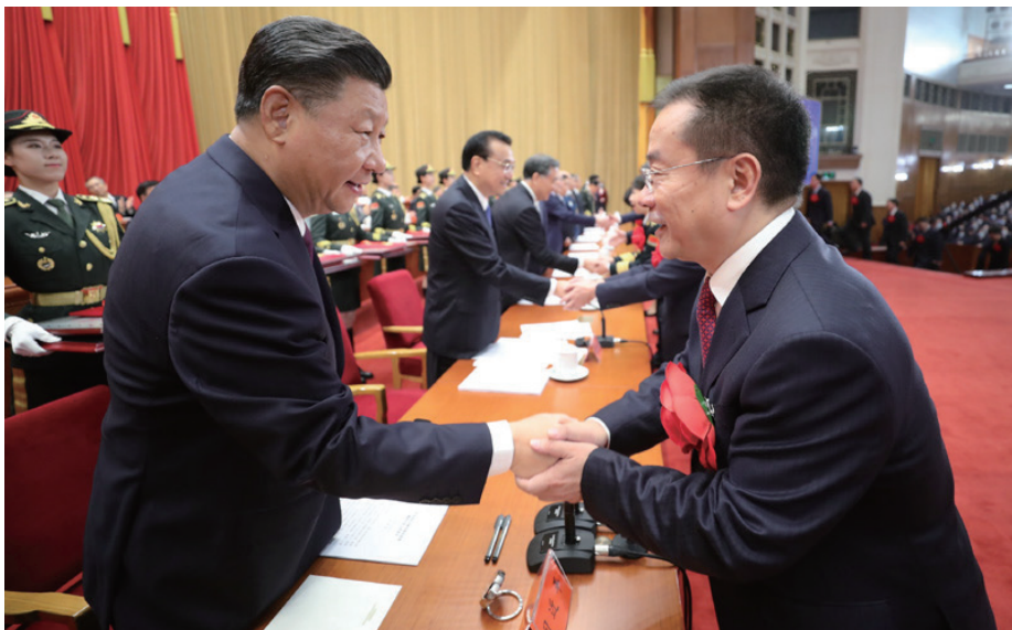
◎ 9月8日，全国抗击新冠肺炎疫情表彰大会在北京人民大会堂隆重举行。中共中央总书记、国家主席、中央军委主席习近平在大会上发表重要讲话。这是习近平等为受表彰的全国抗击新冠肺炎疫情先进个人颁奖。