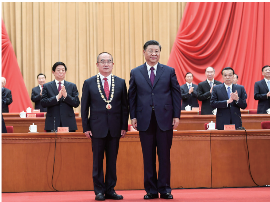
◎ 9月8日，全国抗击新冠肺炎疫情表彰大会在北京人民大会堂隆重举行。中共中央总书记、国家主席、中央军委主席习近平向“人民英雄”国家荣誉称号获得者张定宇颁授奖章。新华社记者 谢环驰 摄