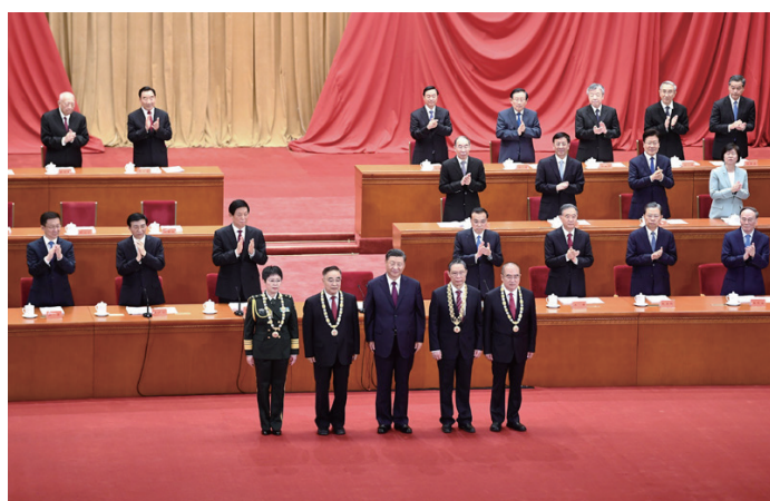
◎ 9月8日，全国抗击新冠肺炎疫情表彰大会在北京人民大会堂隆重举行。中共中央总书记、国家主席、中央军委主席习近平向“共和国勋章”获得者钟南山（前排右二），“人民英雄”国家荣誉称号获得者张伯礼（前排左二）、张定宇（前排右一）、陈薇（前排左一）颁授勋章奖章。