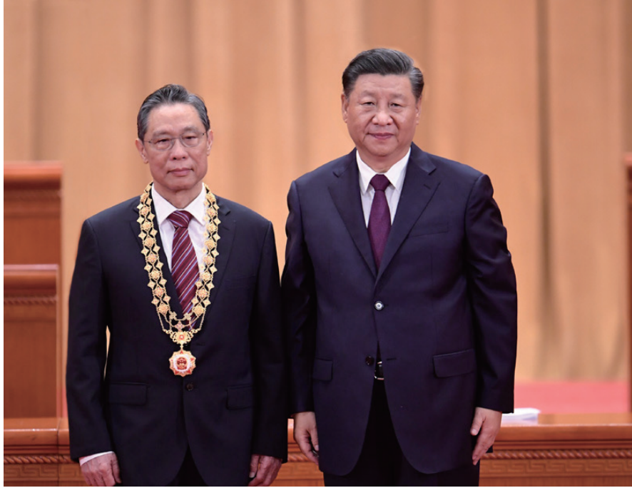
◎ 9月8日，全国抗击新冠肺炎疫情表彰大会在北京人民大会堂隆重举行。中共中央总书记、国家主席、中央军委主席习近平向“人民英雄”国家荣誉称号获得者张伯礼颁授奖章。新华社记者 申宏 摄